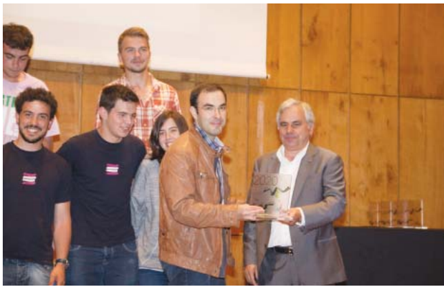
Alto Lima (Arcos de Valdevez), turma Q do 10º ano, do Curso Técnico de Comunicação, o terceiro lugar.

O primeiro prémio da categoria “Desafio Vídeo Alto Minho 2020”, destinada ao ensino secundário e profissional, foi entregue à ETAP de Vila Nova de Cerveira, Curso Técnico de Comunicação, Marketing, Relações Públicas e Publicidade. O Agrupamento de Escolas de Ponte da Barca, turma do 11º E, do Curso Profissional de Técnico de Audiovisuais, conseguiu o segundo prémio, e a Epralima – Escola Profissional do